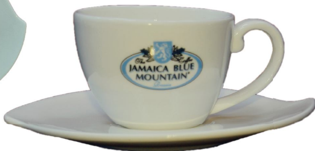
Кофейная пара "ВОЛНА"