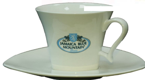
Кофейная пара "ТРИСТАН"